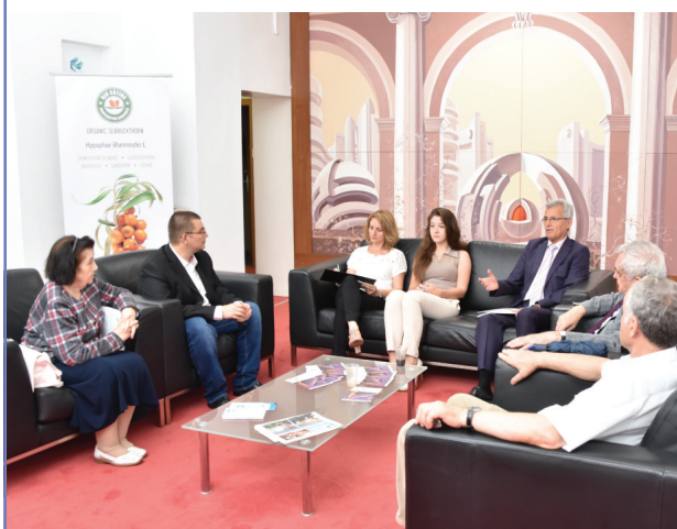
România poate rata dezbaterile europene privind competitivitatea industriei forestiere