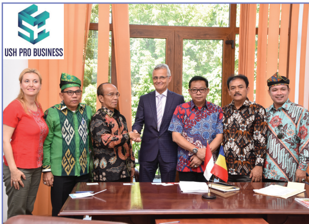
Delegația provinciei Riau din Indonezia ia ca model învățământul privat din România, prin Universitatea Spiru Haret