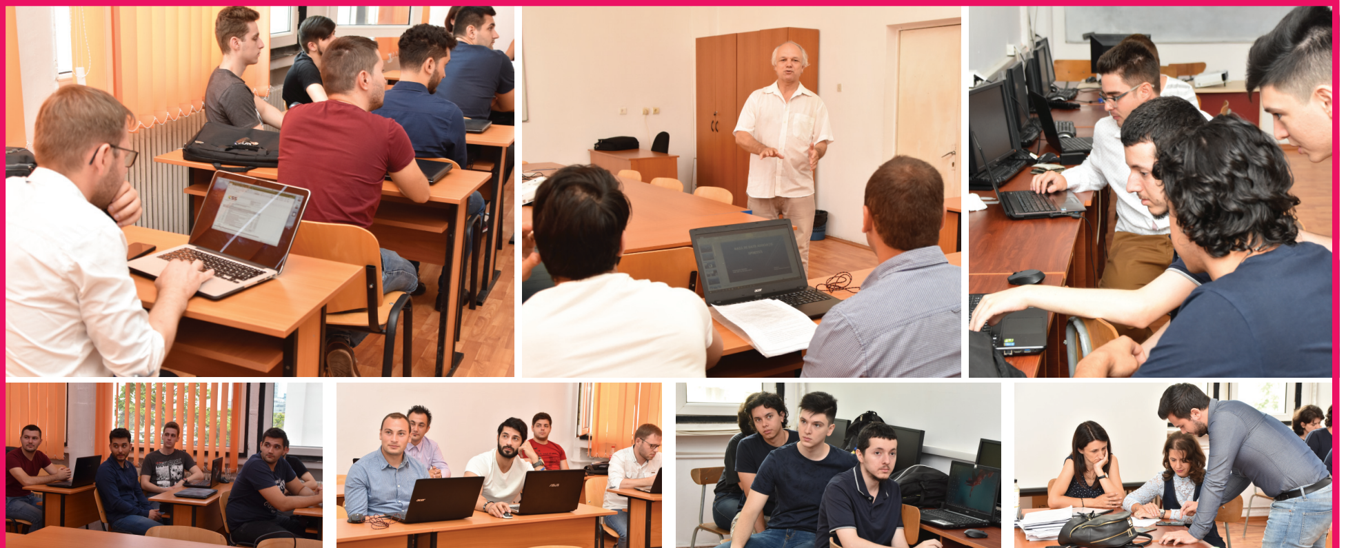
Facultatea de Inginerie, Informatică și Geografie. Imagini din timpul celei de-a doua probe a examenului de licență, programul de studii INFORMATICĂ. Felicitări pentru proiectele realizate și pentru prezentările de înaltă clasă!

■ Colegiul universitar Spiru Haret » pag. 3